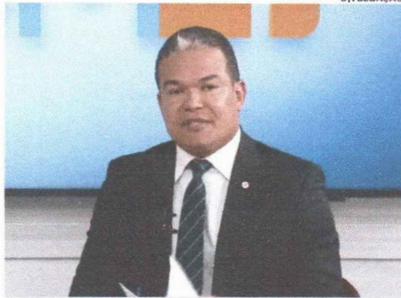
Coronel Sílvio Leite, titular da Secretaria de Estado da Secretaria de Segurança Pública do Maranhão

Dados da SSP-MA apontam a redução em 14% nos roubos a veículos e assaltos a ônibus; de 47% nos homicídios; e 50% nas mortes violentas (lesão corporal, morte, roubo seguido de lesão/latrocínio e homicídios). Isso é fruto dos constantes investimentos que tivemos em segurança pública e que vêm ocorrendo desde 2015. Inclui o aparelhamento do sistema, investimentos em pessoal com capacitação e ações de valorização, aquisição de viaturas, munições e equipamentos, além de investimentos na